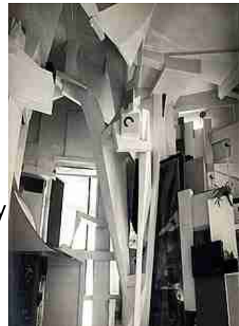
ustrace 2: Schwittersova Merzbau v Hannoveru, foto ze začátku realizace, stavba se nezachovala