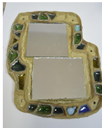
zrcadlo s roztaveným sklem